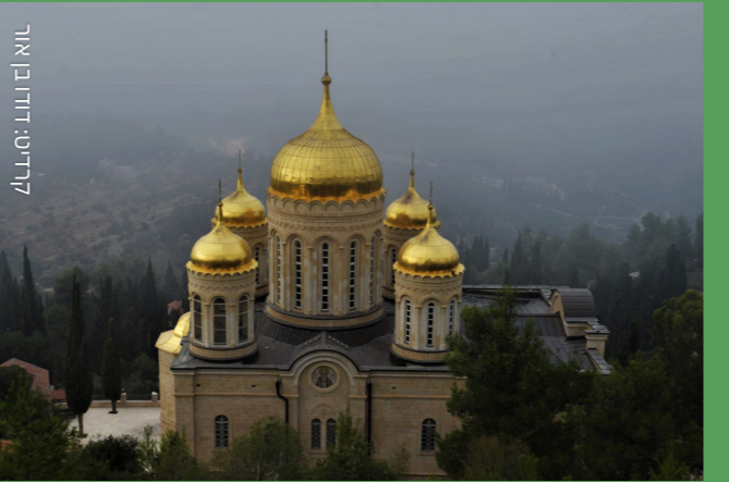
לירי: דודו בן אור

בסמוך לשכונת רמות ישנו שטח בעל מגוון ביולוגי עשיר וחשיבות יוצאת דופן מבחינה אקולוגית. היותו שריד מיער גדול יותר שבעבר הקיף את ירושלים ובית גידול ייחודי לאוכלוסיית הצבאים הגדולה בהרי ירושלים מעניקים לו את חשיבותו הגדולה כל-כך. לאחר מאבק ציבורי עיקש נגד תכניות בנייה בהובלת "רמות למען הסביבה", האזור הוכרז כיער קהילתי על-ידי קק"ל והוגדר על-די החברה להגנת הטבע כאתר טבע עירוני שבו אסור לבנות.